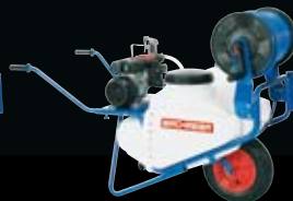
A 75 Elektro