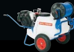
A 130 Benzin