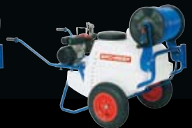
A 130 Elektro