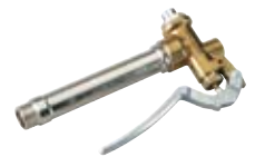
Handventil mit Messinghandgriff 10504006