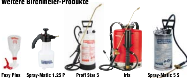
Foxy Plus Spray-Matic 1.25 P Profi Star 5 Iris Spray-Matic 5 S