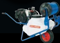
A 75 Benzin