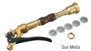
Gun Media 10368301 SB