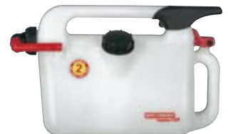
Rapidon 6 11851301