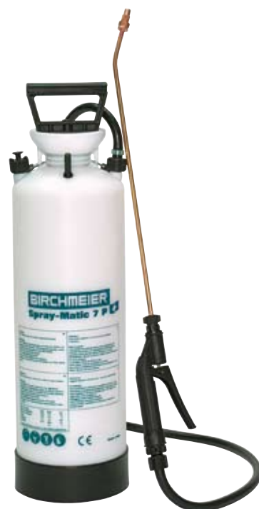
Spray-Matic 7 P

Für ein konstantes Ausbringen von Chemikalien und anderen Sprühmitteln: