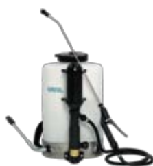
Spray-Matic 10 B