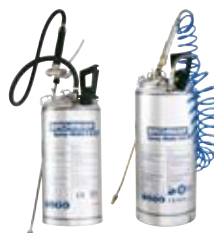
Spray-Matic 5 S / 10 S