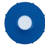
Verschlussdeckel separat 11841014