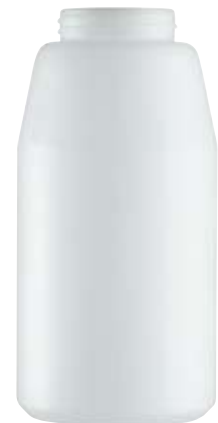
2 Liter Behälter 11841013