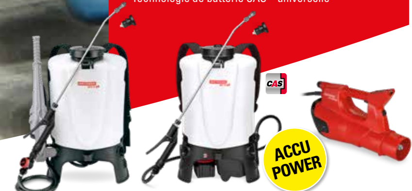
Pulvérisateur à dos RPD 15*