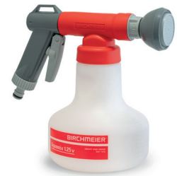
Aquamix 1.25 V Art.Nr. 11953401