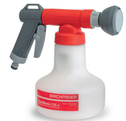
Spezialversion für Nematodenausbereitung AquaNemix 1.25 V Art.Nr. 11953501