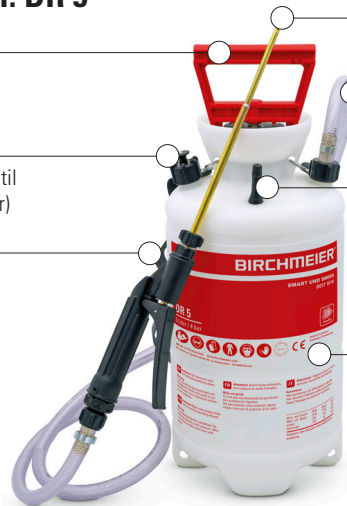
DR 5 Art.Nr. 11625701