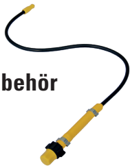
Mini-Flex für DR 5 Art.Nr. 11947101