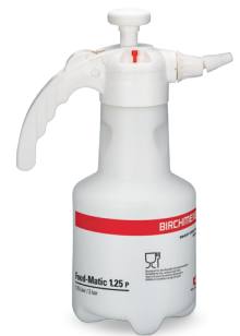
Food-Matic 1.25 P mit Regulierdüse Art.Nr. 11990801