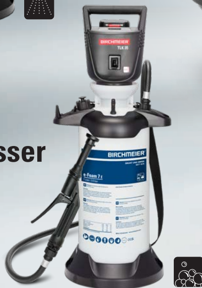
e-Foam 7 E