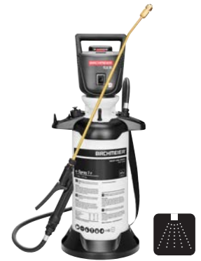
e-Spray 7 P

Le compresseur à batterie puissant assure un débit élevé constant, tandis que le socle large et stable avec support de lance intégré garantit une bonne stabilité et une manipulation pratique, même dans des conditions difficiles.