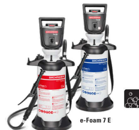
e-Foam 7 P

Le réservoir peut être entièrement vidé sans interruption, ce qui permet un nettoyage rapide et étendu. L'appareil, avec son grand pied stable et son support de tube de mousse intégré, assure une stabilité sûre.