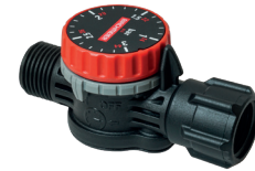
Einstellbares Druckregelventil PR 3 (1-3 bar)