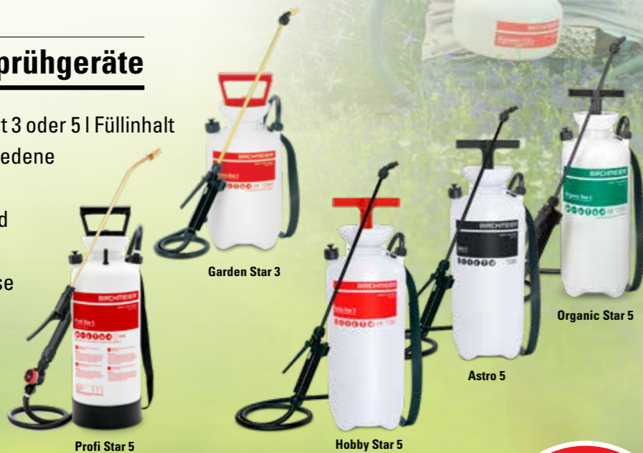
Profi Star 5 Garden Star 3 Hobby Star 5 Astro 5 Organic Star 5