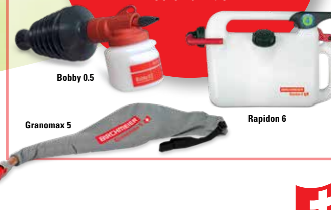
Bobby 0.5 Granomax 5 Rapidon 6

Birchmeier-Spezialprodukte zum stäuben, tanken und streuen: Bobby 0.5 – gezielt stäuben Rapidon 6 – Tanken auf Knopfdruck Granomax 5 – Granulatstreuer mit Dosierfunktion