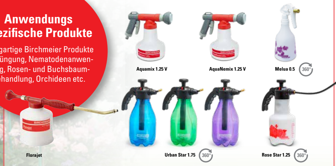
Florajet Aquamix 1.25 V AquaNemix 1.25 V Melua 0.5 360° Urban Star 1.75 360° Rose Star 1.25 360°

Einzigartige Birchmeier Produkte für Düngung, Nematodenanwendung, Rosen- und Buchsbaum-Behandlung, Orchideen etc.