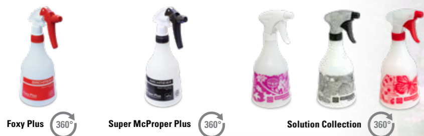
Foxy Plus 360° Super McProper Plus 360° Solution Collection 360°