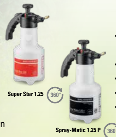
Super Star 1.25 360° Spray-Matic 1.25 P 360°