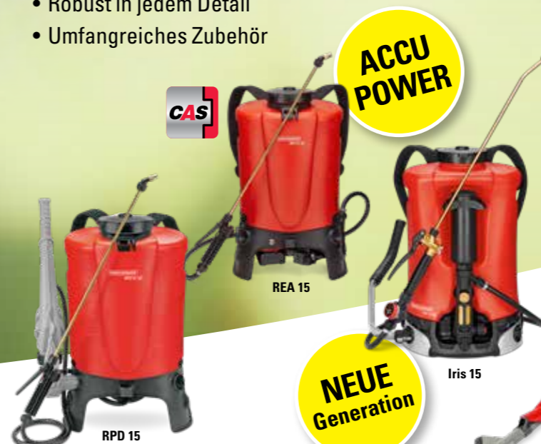
RPD 15 REA 15 Iris 15