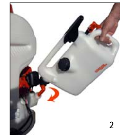
Beim Befüllen (Bild 1) den Kanister möglichst gerade halten. Um den Tankstutzen vollständig zu entleeren, Kanister leicht kippen (Bild 2), damit das Restbenzin aus dem Tankstutzen abfließen kann.