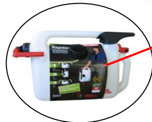
Kleber für Inhaltsbezeichnung und Funktionsbeschreibung Siehe Bänderolen-Innenseite