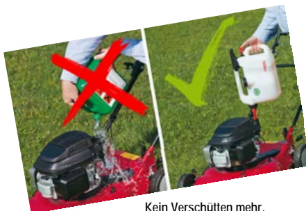
Kein Verschütten mehr, einfach und sauber tanken